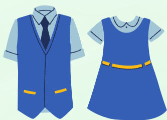
1) 冬/ 夏季校服