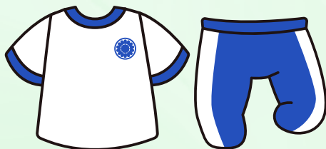
2) 冬/ 夏季運動服